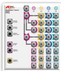
No. 36922 ノーベルリプレイス・テーパード ガイディッドドリリング キットプレート