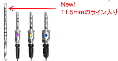
New! 11.5mmのライン入り No. 36123 ガイディッドツイストドリルテーパード 2x(10+) 8-16mm No. 36119 ガイディッドテーパードドリル NP 11.5mm No. 36120 ガイディッドテーパードドリル RP 11.5mm No. 36121 ガイディッドテーパードドリル WP 11.5mm

既存のガイディッド・ツイストドリル・テーパード 2x (10+) 8-16mm (No. 32744) は、11.5mmのライン入りドリル(No. 36123) の発売に伴い、在庫が無くなり次第、販売終了となりますのでご了承ください。