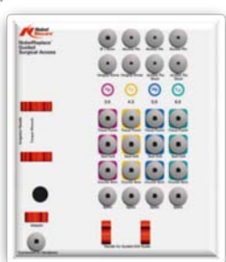
No. 36921 ノーベルリプレイス・ガイディッド アクセス キットプレート

既にノーベルリプレイス・テーパード・ガイドッド外科用キットをお持ちの場合、アップグレード・パッケージをご注文いただければ、点線枠内に記載の下記製品がすべて含まれております。